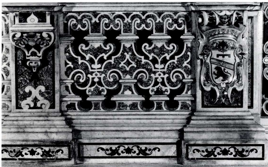
6. D. Lazzari, Balastra del presbiterio, Chiesa delle Anime del Purgatorio ad Arco, Napoli.