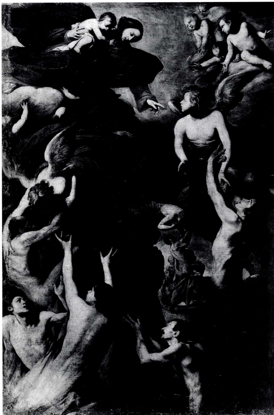
2. M. Stanzione, Madonna col Bambino e Anime purganti , Chiesa delle Anime del Purgatorio ad Arco, Napoli.